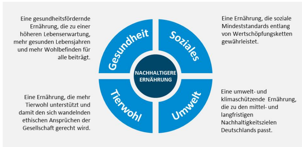
Abbildung: Die vier zentralen Ziele einer nachhaltigeren Ernährung („Big Four“)

Die folgenden Abbildungen stehen in druckfähiger Auflösung zum Download auf der Webseite zum Gutachten unter Angabe der Quelle (WBAE 2020) zur Verfügung ( www.nachhaltigere-ernaehrung-gutachten.de )